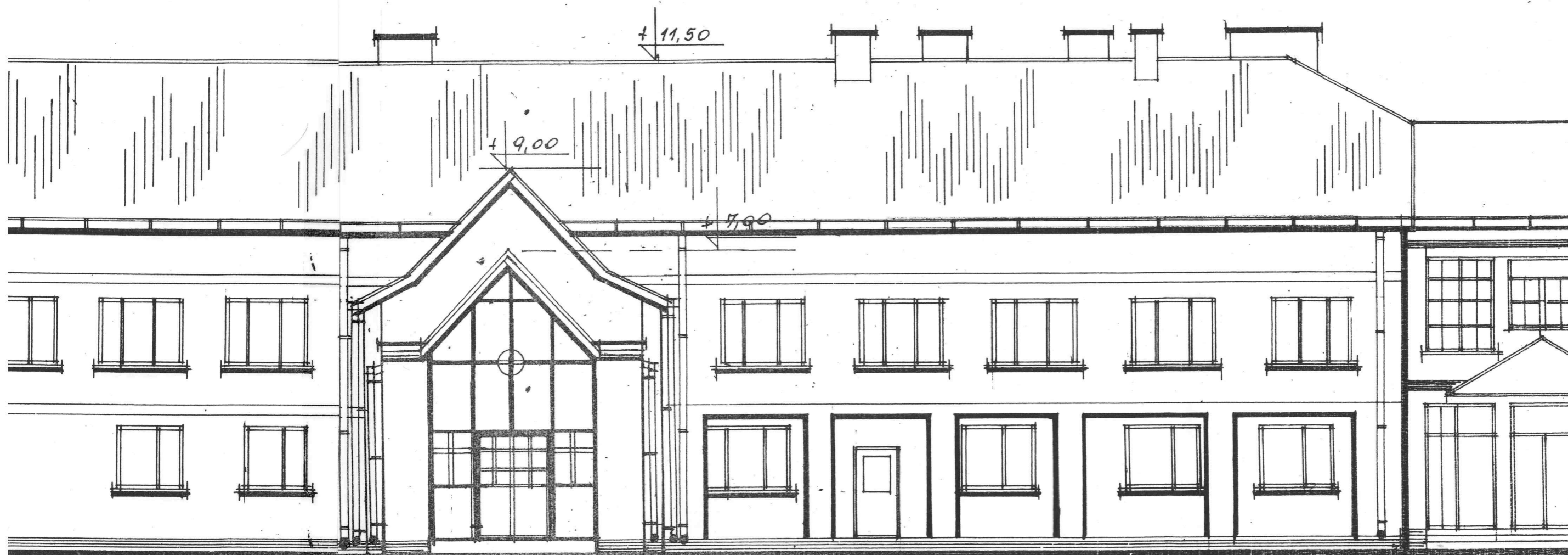
elevacja od ulicy 1:100